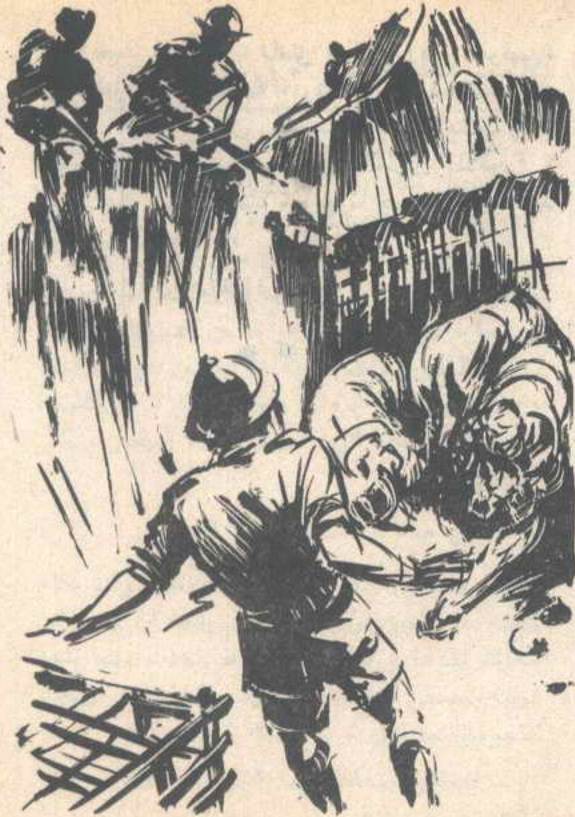
وفجأة انهالت عليها رصاصاتنا .. وأصيبت الأسود بالذهول ، فتراجعت في ذعر ..

وأصيبت الأسود بالذهول ، فتراجعت في ذعر ، في حين قفز ( جافيت ) إلى حيث الأستاذ ، وجذبه