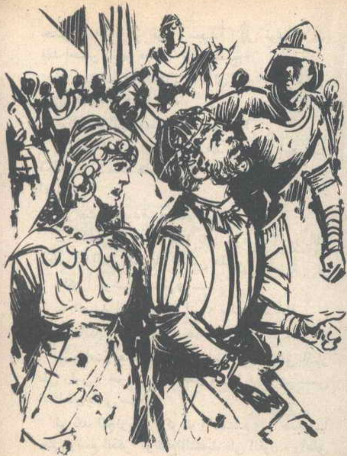
ولم يكذب يقترب منهم حتى انقض عليه بغته العم (جوشيا) مشهراً سيفه ، وخلفه بعض الرجال ..

كان من المؤلم والعسير بالنسبة إلى أن اتخذ قرارى ، فقد كان يعنى التضحية تماماً بولدى ، من أجل التمسك بوعد لامرأة تحكم شعباً من الجبناء ، ولكن السلطان لم ينتظر جوابى ، وإنما قال فى أسف :