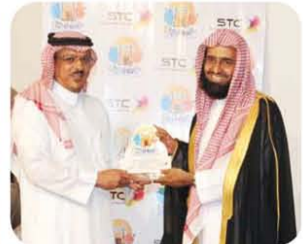
الاتصالات السعودية تكرم الشيخ د. عبدالعزیز الفوزان خلال فعاليات خيمة أبها الدعوية