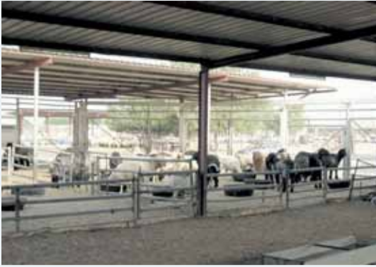
جانب من أحد أسواق الأغنام