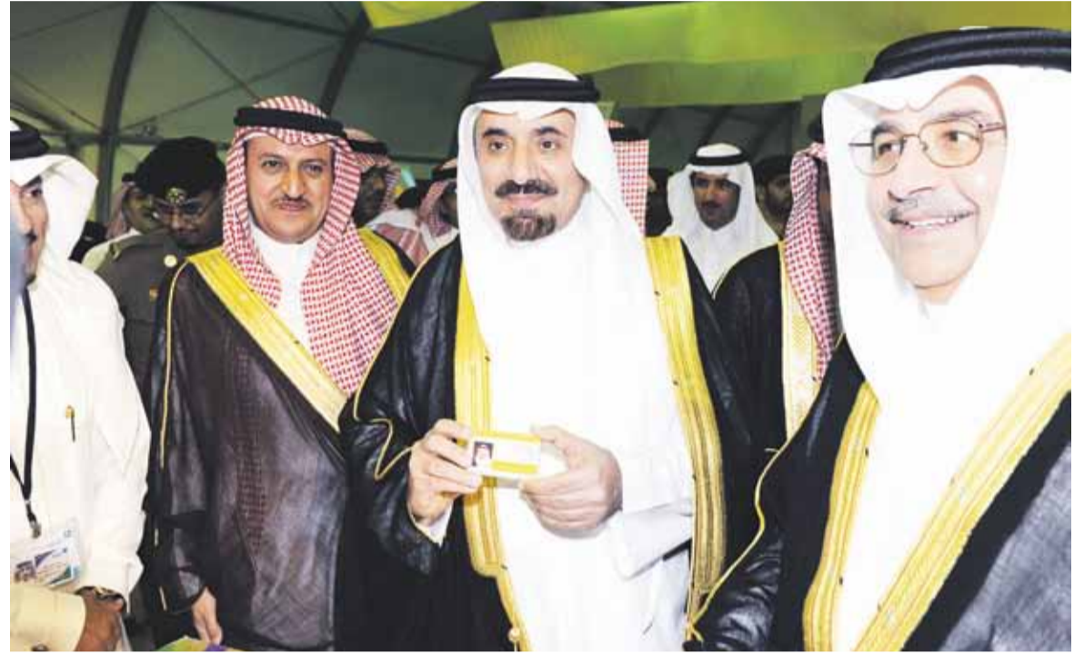
خلال زيارة سموه لبرنامج صيف أرامكو

حديقة السلامة المرورية تكرم سموه برخصة افتراضية