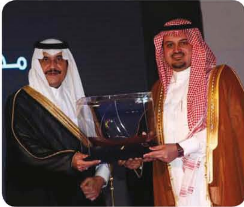
أمير المنطقة الشرقية يكرم الاتصالات السعودية لرعايتها فعاليات مهرجان صيف الدمام