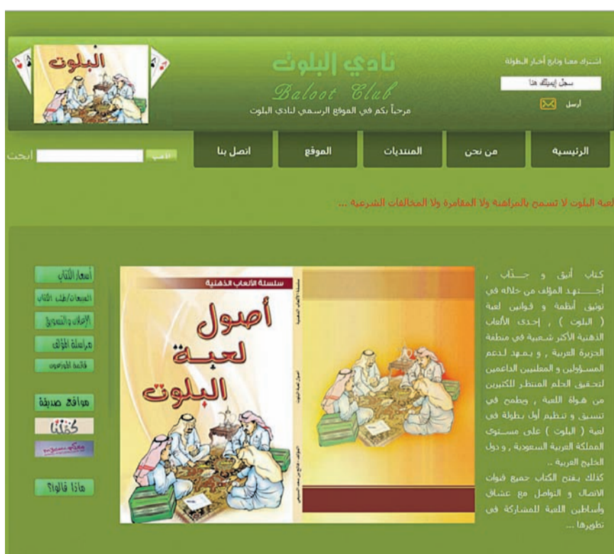
صورة من الموقع الإلكتروني لنادي لعبة البلوت