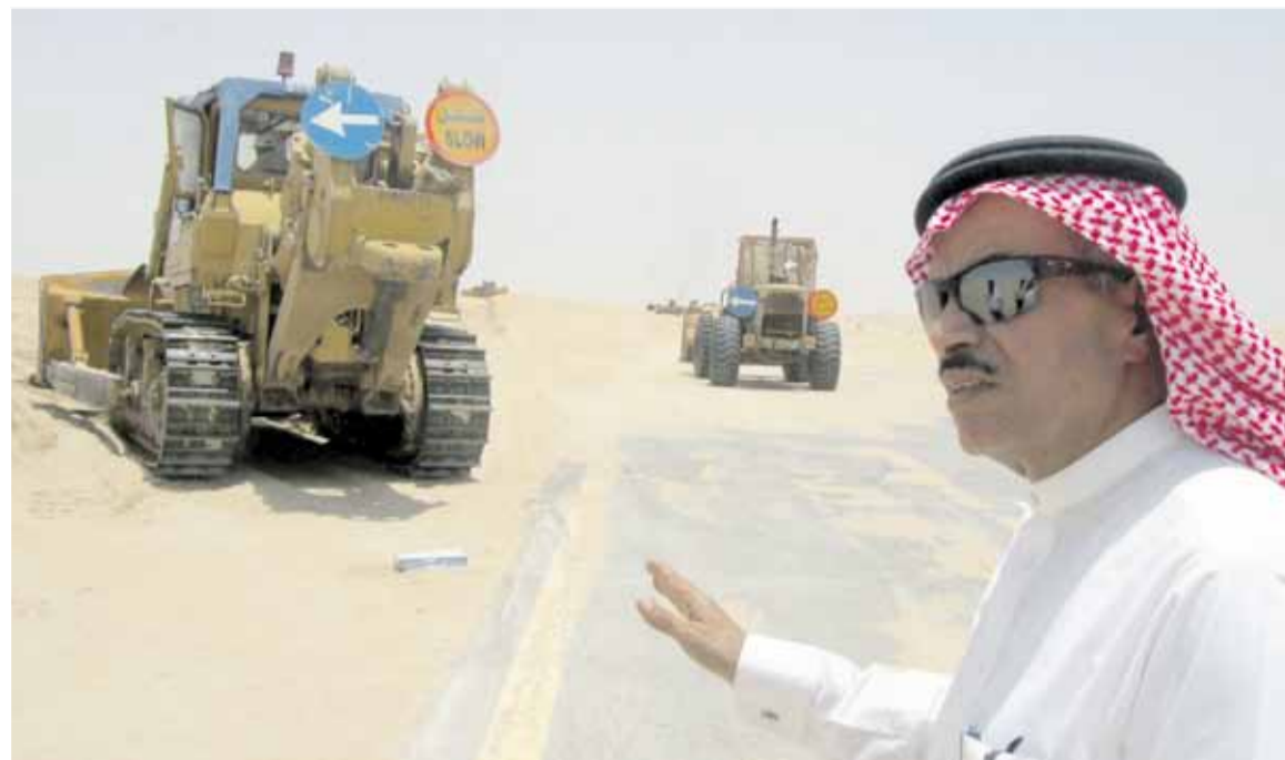
السويكيت تفقد مشاريع حفر الباطن وقرية العليا (اليوم)

ولفت إلى اعتماد مبنى لرفع الوزارة بحفر الباطن في الجمع الحكومي بقيمة (5) ملايين ريال ودعمه بالكوادر المدربة ، بالإضافة إلى تعديل المنحنى على طريق حفر الباطن - القيصومة بعد أخذ موافقة شركة أرامكو .