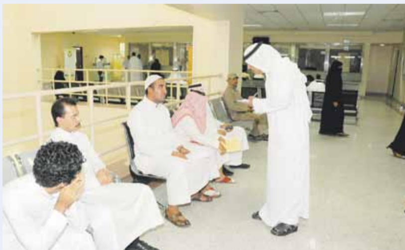
الأولوية ان يأتي مبكرا

له الخدمة والزحام روتيني مع تزايد المراجعين ولكن لا يوجد مراجع خرج بدون ان ينهي إجراءات معاملته . وقال ان اغلب المراجعين بشأن البصمة واستبدال البطاقة القديمة بالبطاقة الوطنية الحديثة والوضع لا يمثل أي مشكلة . . ومن يشتكي من طول الانتظار عليه أن يعلم أن من قبله هو مواطن حصل على موعد عن طريق النت وهذا المتقدم عن طريق النت لا يصل الاحوال إلا مع مواعده وتنتهي إجراءاته في الحال .