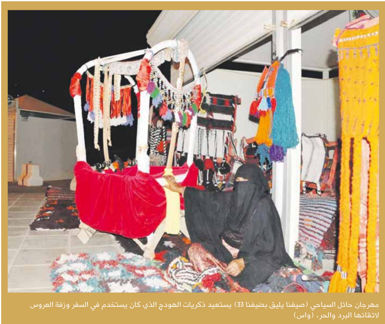
مهرجان حائل السياحي (صيفنا يليق بضيفنا 33) يستعيد ذكريات المودج الذي كان يستخدم في السفر وزفة العروس لاتقانها البرد والحر. (واس)