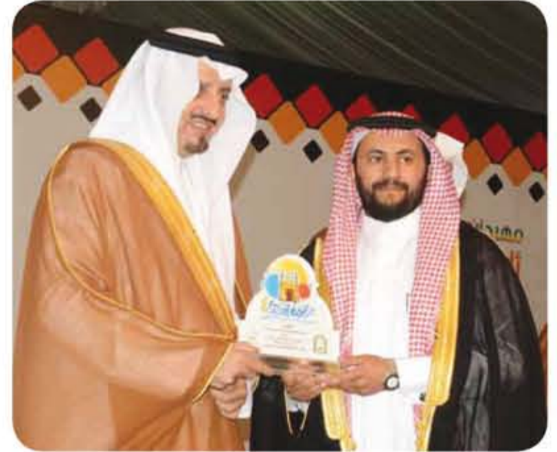
أمير منطقة عسير يكرم الاتصالات السعودية على دورها في مهرجان صيف أبها

امتداداً لما تقدمه من رعاية لبرامج المجتمع والأنشطة التي تهم كل أفراد الأسرة. وذلك من خلال تقديمها برامج تجمع بين المتعة والفائدة لتصبح محل اهتمام ومتابعة من الجميع. حيث تركزت حول الألعاب المسلية والرسم والتلوين والمسابقات الهادفة التي تم توجيهها للأطفال الذين هم محور اهتمام الأسرة والمجتمع. كما أسهمت في رعاية برنامج مارشون الطفل الذي شارك فيه مجموعة من الأطفال بتشجيع من ذويهم والحضور. تنافس فيه المشاركون وقدمت لهم الاتصالات جوائز للعبارة الأولى للمسابقات الفنية تحت عنوان لوحة قيمة يتم كل يوم من خلالها طرح قيمة اجتماعية تركزت في غالبيتها على حب الوطن والقيم الاجتماعية.