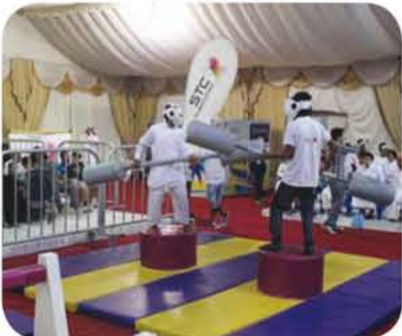
إحدى فعاليات مهرجان صيف الدمام

ومن هذا المنطلق دعمت الاتصالات السعودية للعام الثالث على التوالي ”مهرجان صيف الشرقية“ 1433 الذي انطلق تحت عنوان ”فكر النوايا كشریک إستراتيجي وذلك في الواجهة البحرية بالدمام من خلال تنظيم مناشط وبرامج يومية لسكان المنطقة وزارها من مختلف مناطق السعودية ودول الخليج حيث دمجت تقديم المعرفة بالهدايا والجوائز المتنوعة كتحفيز على حضور المناشط اليومية والتفاعل معها طوال فترة صيف الشرقية.