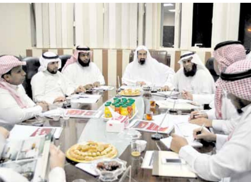
من المؤثر الصحفي بقمر هداية (اليوم)

إلى نساء داعيات يقدمن البرامج الدعوية ويشرفن على المخيمات النسائية، مبينا أن هذه الاشكالية تأتي بشكل عام على مختلف الأنشطة الدعوية التي تستهدف النساء من الجاليات المختلفة بالملكة.