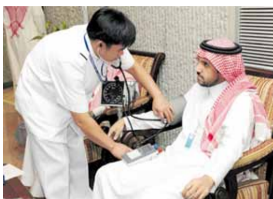
الكشف الطبي قبل التبرع