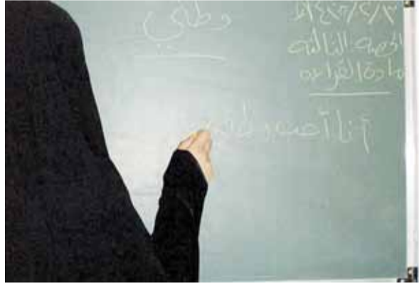
احدى المعلمات وهي تشرح داخل الفصل

مضى على تعييني قرابة 3 سنوات، وعلى الرغم من ذلك لازلت مصرة على رأيي في التعيين، ففي كل مرة أقدم لوظيفة يتم وضع شروط لشغلها وكنت في بعض الأحيان كل هذه الشروط تطبق علي ولكن لا يتم ترشيحي للوظيفة لأسباب غامضة، لدرجة أنني حصلت على العديد من الدورات التدريبية التي كانت من حسابي الشخصي بهدف عدم ضياع فرصة التعيين، ولكن في اعتقادي أصبحت هذه الفرصة تتلاشى بعد مضي هذه السنوات وتزايد أعداد الخريجات.