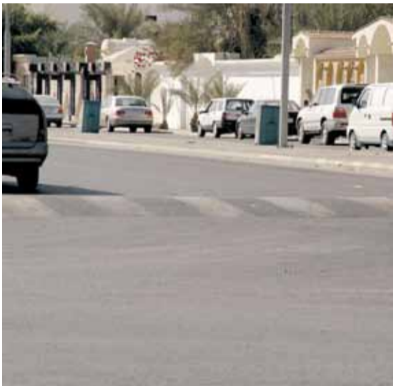
مكتب رعاية الشباب بالدامم له أكثر من مبرر مقنع

أهالي حي البديع شارع (11 ب) مقابل مكتب رعاية الشباب بالدامم يطالبون بوضع مطبة اصطناعية أمام البوابة الرئيسية او الباب الأخرى للمكتب وذلك للسرعة التي يسوق بها البعض، مع العلم انه تم وضع مطبة اصطناعية بمنتصف الشارع وهذا لا