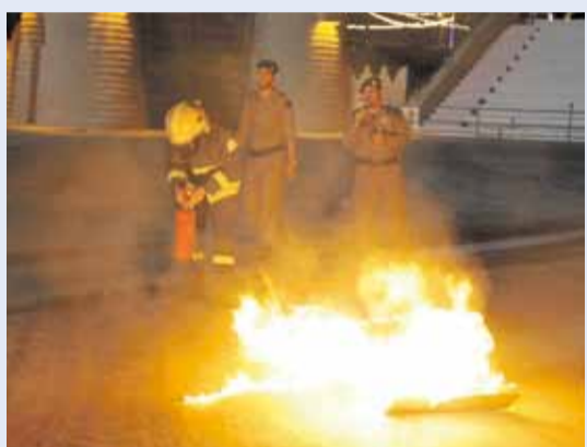
من التمرين الوهمي بمهرجان حائل (اليوم)