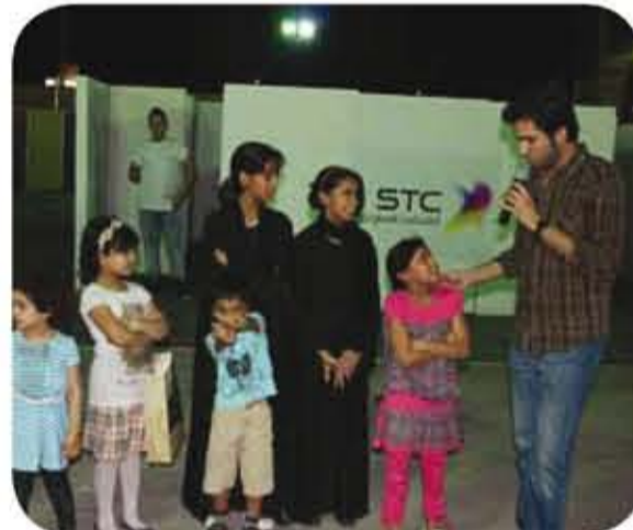
الاتصالات السعودية ترسم الابتسامات على وجوه الأطفال خلال فعاليات مهرجان صيف الأحساء