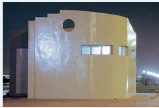
دورة للمياه بأحد الشواطئ