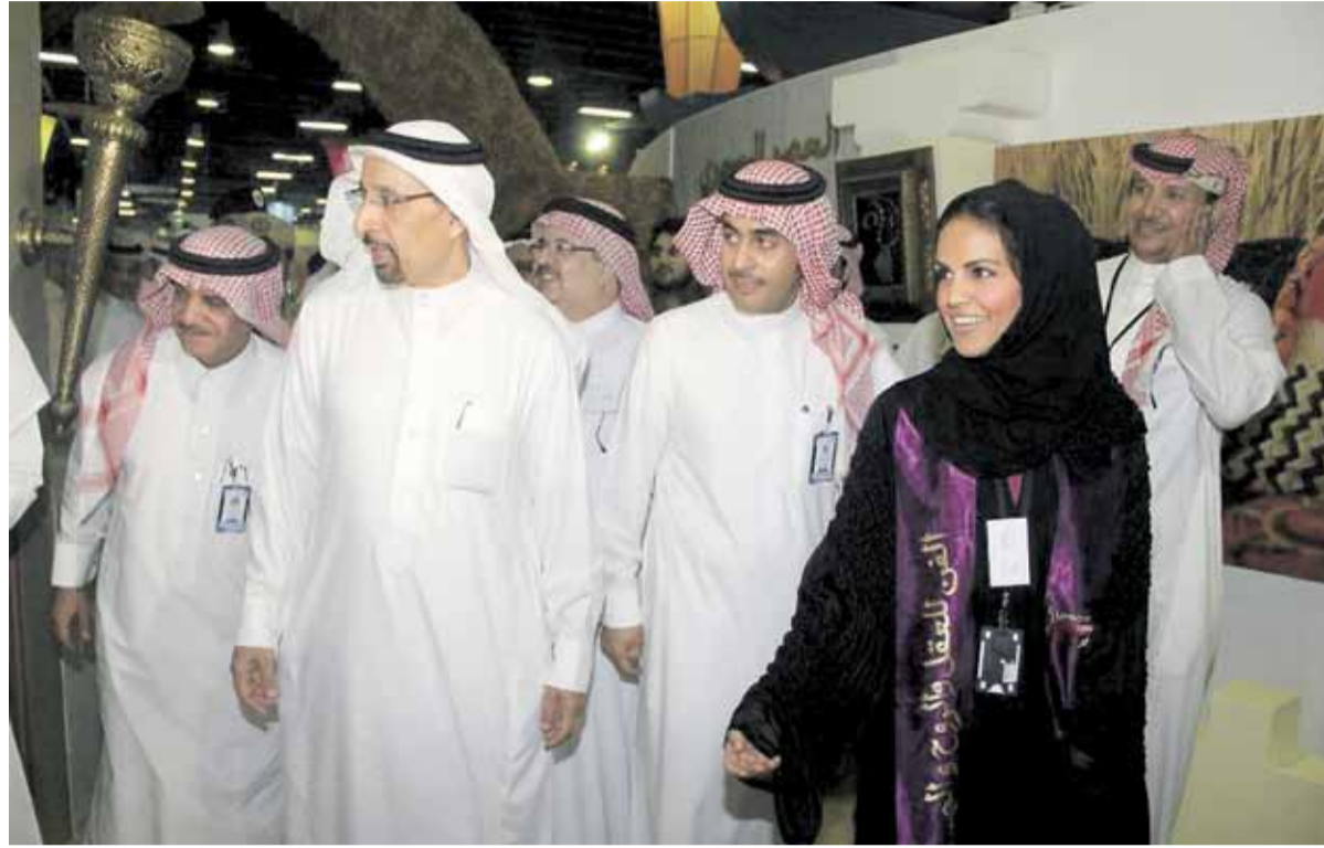
القائم مدير شركة أرامكو يتجول في أرجاء المعرض

لقد صممت البوابة على شكل كهف من كهوف ما قبل التاريخ حيث كان رجل الكهف في العصر الحجري ينحت حياته على شكل رموز وأشكال على جدران بيته الحجري وقد تم عرض بعض المنحوتات من حضارات قديمة كحضارة دلون و اختتامهم الشهيرة المنحوتة على الحجر.