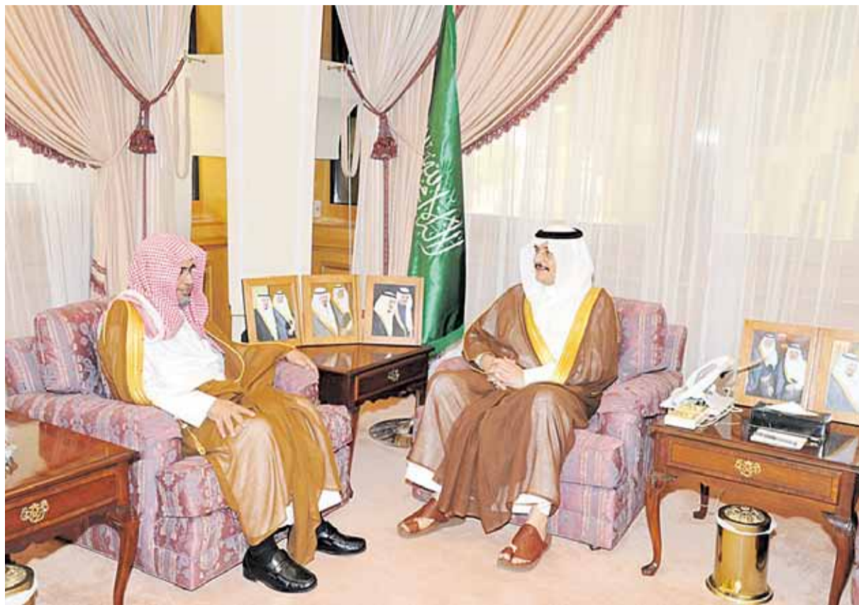
أمير الشرقية خلال استقباله رئيس محكمة الاستئناف الإدارية ( اليوم )

استقبل الرشيد واستمع لشرح عن إنجازاتها وتقليص مدة التقاضي