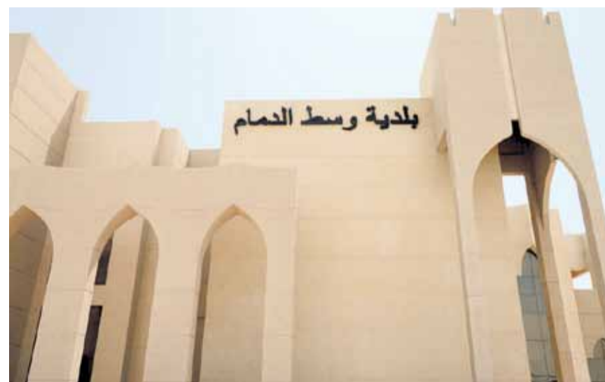
البنى روعي بتصميمه الحدائثة والبساطة (اليوم)