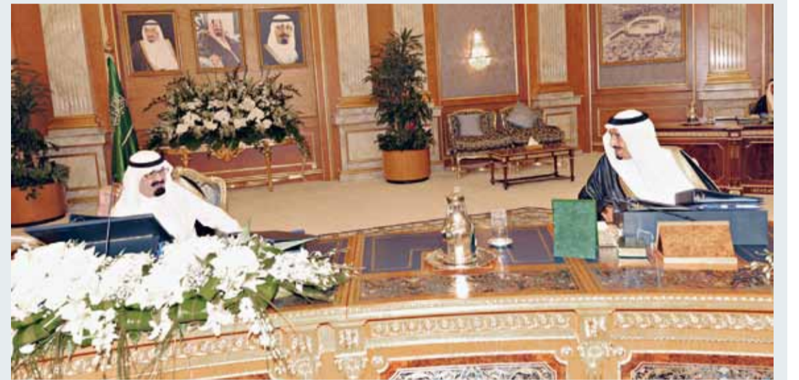
الملك المفدى وسمو ولي العهد خلال جلسة مجلس الوزراء بجدة أمس