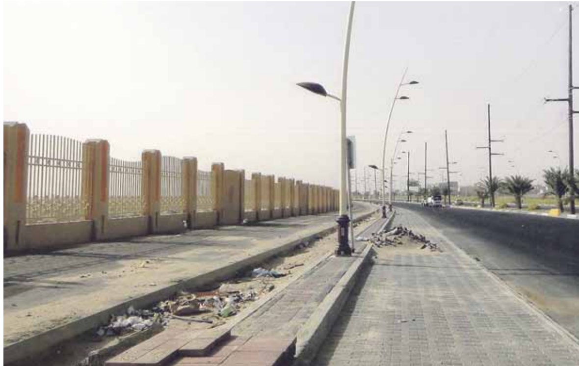
جانب من الشارع المعني بالملاحظة

يشتكى مستعملو طريق الأمير فيصل بن فهد بالهشوف من سوء وإنارة الطريق وبعدها عن منتصف الشارع حيث لا توجد أعمدة إنارة بمنتصف الشارع نظرا لوجود أعمدة وخطوط الضغط العالي التابعة للشركة السعودية للكهرباء وعلى الرغم من انتهاء الحفريات في ذلك الشارع إلا ان الطبقة الإسفلتية لا تزال منخفضة والدليل على ذلك ارتفاع غرف التفريش وتهديدها للسيارات العابرة وخاصة بالليل حيث تزداد أمانة الاحساء ضرورة تقوية إنارة الشارع ورفع مستوى الشارع بطبقة إسفلتية ثانية لسلامة وسلاسة الحركة المرورية.