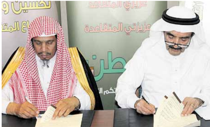
من توقيع الاتفاقية بين "الجمعية" و"إسكان المتقاعدين" (اليوم)