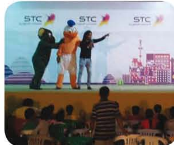
جانب من فعاليات مهرجان صيف الباحة