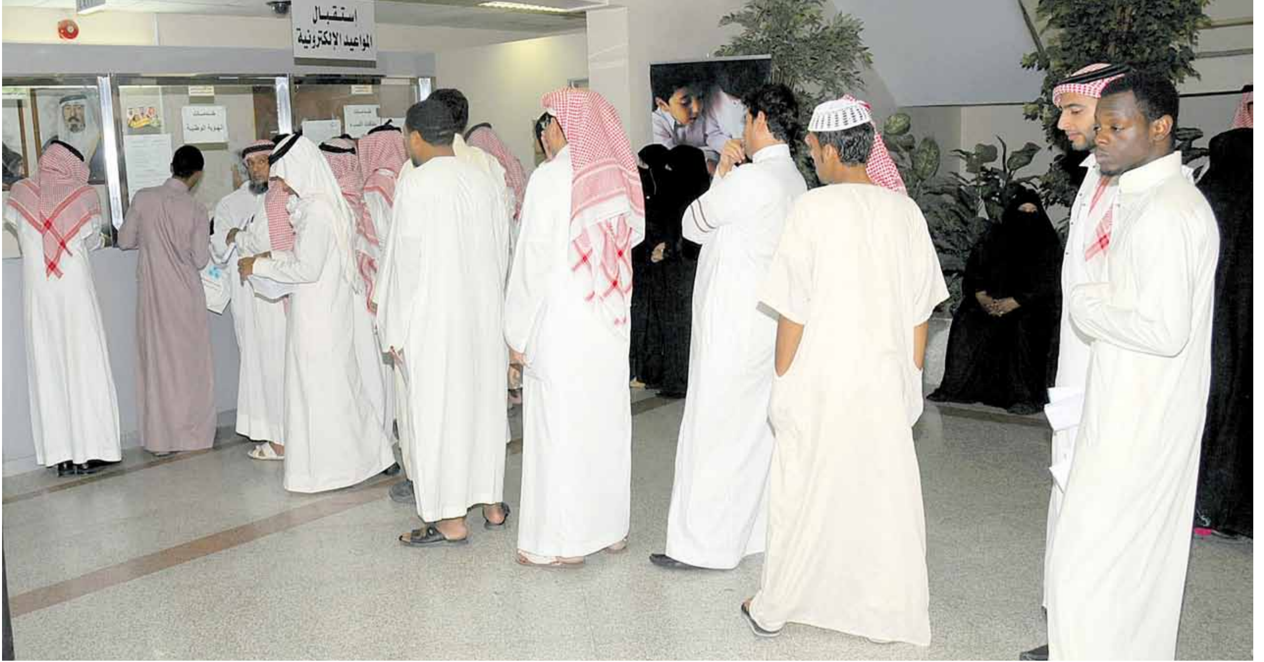
طوابير طويلة للمراجعين رجالاً ونساءً

وسط حرارة الأجواء الملتهبة والرطوبة التي تشهدها المنطقة في أشهر الصيف ، وبينما يذهب البعض الى المصايف هرباً من السخونة وبحثاً عن نسمة هواء اضطرت ظروف البعض الآخر أن يقفوا في طوابير طويلة لانجاز معاملاتهم المتأخرة في الدوائر الحكومية ، وجد بعضهم « المعاناة » في انتظاره جسدها موظفون لم يضعوا خدمة المراجعين على قمة أولوياتهم ، بينما قام موظفون آخرون بأداء أعمالهم على أكمل وجه ، وبين هؤلاء وأولئك تنقل محررو « اليوم » بين العديد من الجهات الحكومية في الصيف لتنقل معاناة المراجعين ، كما تلقى الضوء على النماذج الايجابية التي وضعت شعار خدمة المراجع .