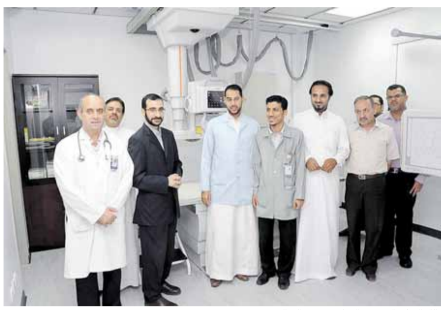
طاقم العمل عقب تدشين الجهاز