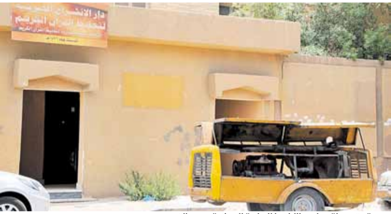
مدرسة متوسطة حولت طلابها للدراسة المسائية بسبب الترميم

نتيجة أعمال الترميم أو الصيانة، وعن عدد المدارس التي بدأت أعمال الصيانة والترميم بها حيث يبلغ عدد المدارس الحكومية ثلاثة آلاف مدرسة للبنين والبنات في منطقة الرياض وحدها، تبين أنها حوالي 700 مدرسة على مستوى المملكة. وبين المصدر ان هذه اللجان تتابع وضع ترتيبات قبول الطلاب والطالبات في العام الدراسي الجديد، ومناقشة المدارس والاحياء التي قد يكون بها ازدحام في القبول والحلول المقترضة مثل فتح فصول إضافية في المدارس القابلة للنمو، والتعرف على العجز الذي قد تواجهه الادارة في التجهيزات