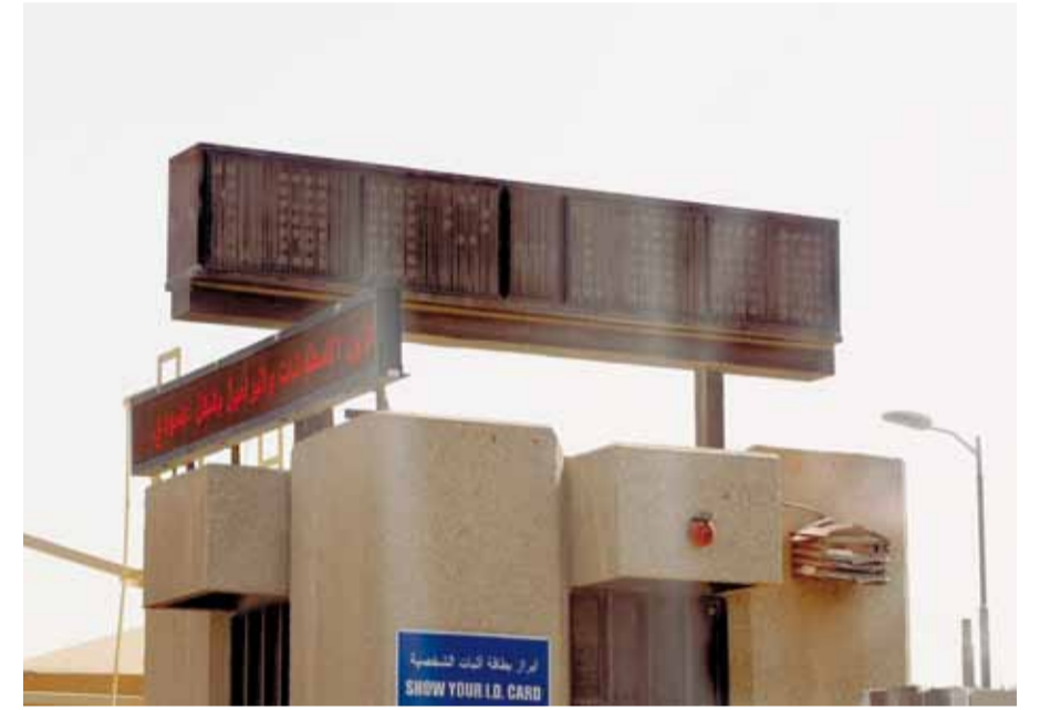
شاشات درجات الحرارة تحولت إلى ديكور

● رائد الحربي - الدمام فيما لامست حرارة المنطقة الشرقية امس حاجز الـ 50 درجة مئوية، وارتفعت نسبة الرطوبة بالقرب من البحر. رصدت عدسة «اليوم» العديد من شاشات درجات الحرارة المعتمدة في المنطقة معطلة وخارج الخدمة. وفي سياق متصل أوضحت الرئاسة العامة للأرصاد وحماية البيئة أن طقس اليوم معتدل نهاراً لطيف ليلاً على الصافي مع فرصة لتكون السحب الركامية على اجزاء من مرتفعات جازان وعسير في حين تنشط الرياح السطحية وتحد من مدى