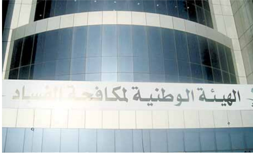
هيئة مكافحة الفساد (اليوم)

«نزاهة» عشوائية وتخط في إنشاء مستشفى بجدة