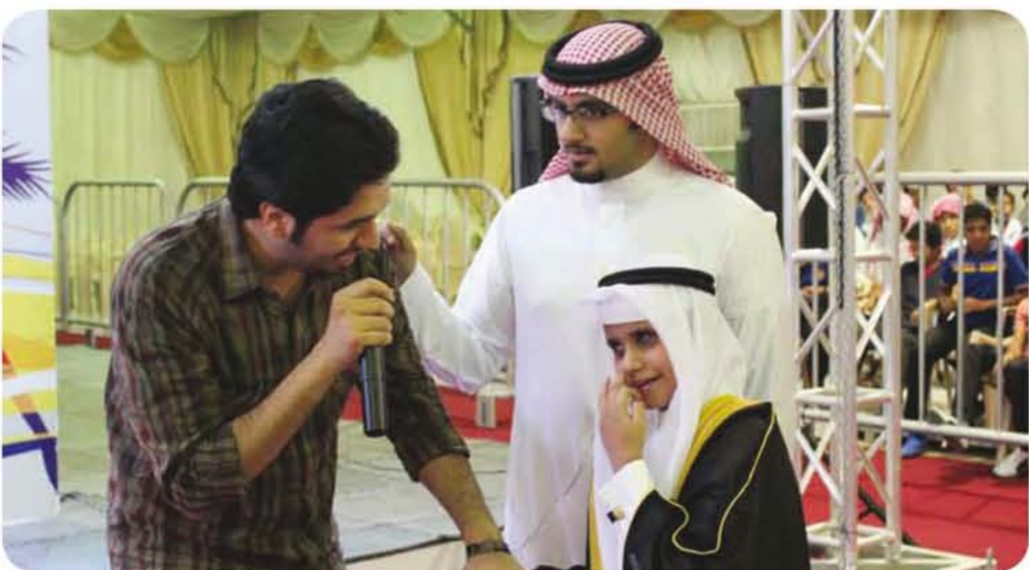
الاتصالات السعودية تلامس قلوب ذوي الاحتياجات الخاصة في مهرجانات الصيف

كأكبر مبادرة اجتماعية قدمها القطاع الخاص لدعم الخدمات الصحية في المملكة بشكل مباشر ومنظم. حيث تبرعت الاتصالات السعودية بمبلغ 100 مليون ريال لإنشاء وجهز العديد من المراكز الصحية للرعاية الأولية في عدد من المدن والقرى على مستوى المملكة. علماً بأن الشركة لم تغفل ابنائها من ذوي الاحتياجات الخاصة حيث أوجدت فعاليات تتناسب مع إمكانياتهم وقدراتهم. مع نهية أماكن الفعاليات لتسهيل على ذوي الاحتياجات الخاصة الخاصة التنقل بين مواقع الفعاليات المختلفة.