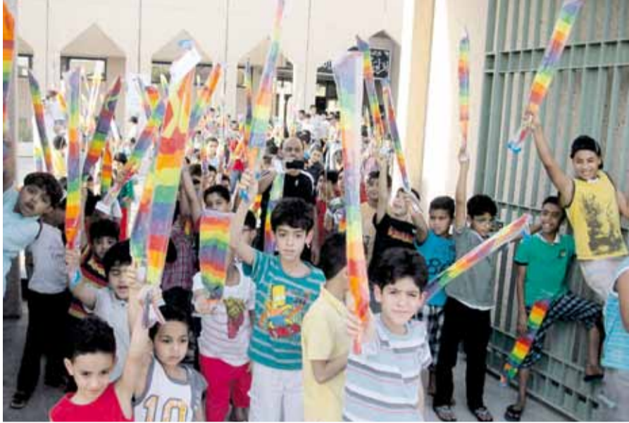
جانب من الفعاليات (اليوم)