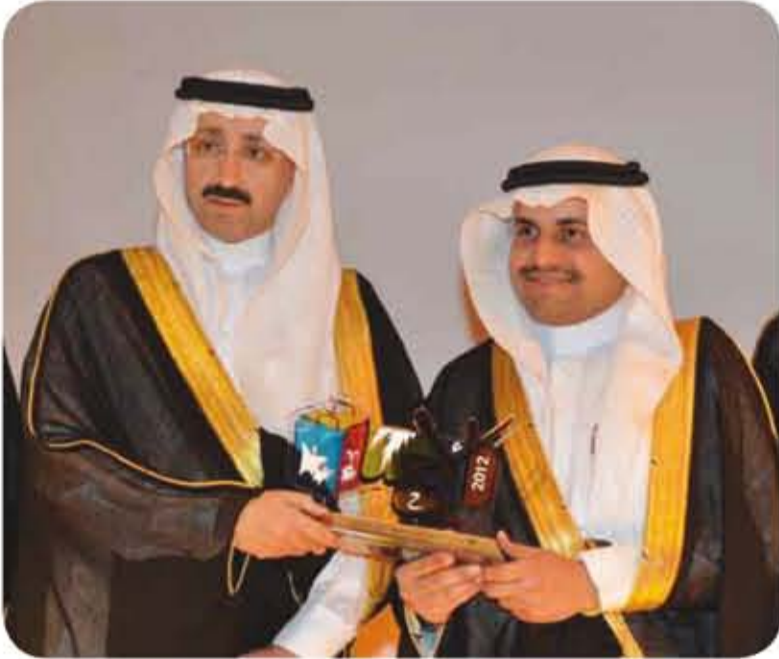
أمير محافظة الأحساء يكرم الاتصالات السعودية لدعمها المهرجان الصيفي