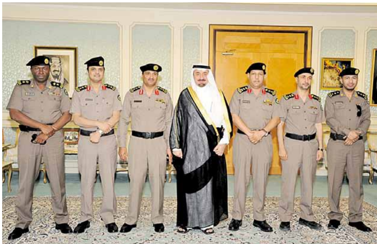
الأمير جلوي يتوسط مديري إدارات المرور بالمنطقة ( اليوم )

الأمين صاحب السمو الملكي الأمير سلمان بن عبدالعزيز نائب رئيس مجلس الوزراء وزير الدفاع " بحفظهم الله " ومتابعة صاحب السمو الملكي الأمير أحمد بن عبدالعزيز وزير الداخلية "حفظه الله" ، ومن جهته أعرب مدير مرور المنطقة الشرقية العقيد عبدالرحمن الشنبري عن شكره لصاحب السمو الملكي الأمير محمد بن فهد بن عبدالعزيز أمير المنطقة الشرقية وسمو نائبه على دعمهما ومتابعتهم لأعمال إدارة المرور وتوجيهاتهما التي تصب في مصلحة الوطن والواطن .