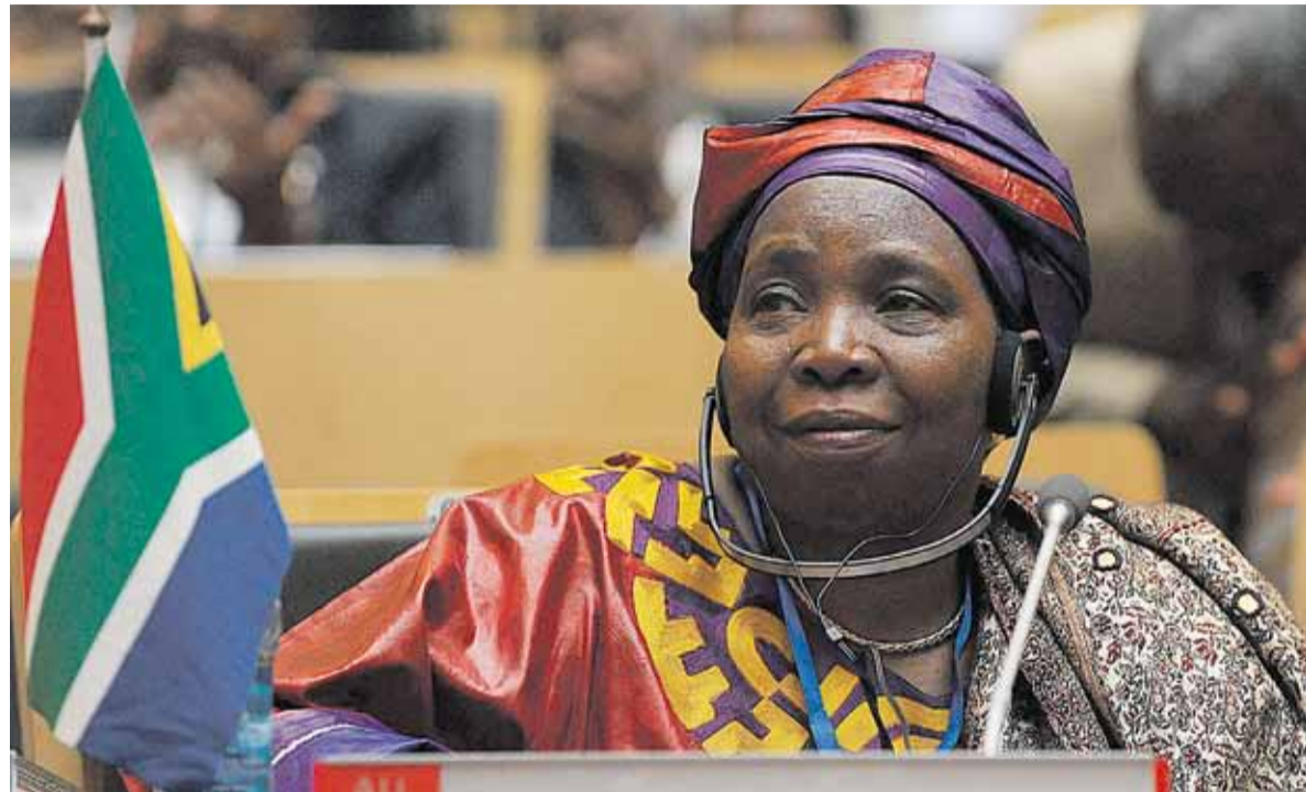
وزيرة الداخلية في جنوب أفريقيا نكوسازانا دلاميني

أما عن الأزمات الإقليمية، فقد انتفضت الدول الأعضاء على دعوة المجلس العسكري الحاكم في مالي لتقديم استقالته. وأدى الانقلاب العسكري الذي مكن العسكريين من زمام السلطة في مالي في مارس إلى فقدان الحكومة سيطرتها على الشمال، ما فتح الطريق أمام حركة انفصالية مدعومة بالسلاميين كي تفرض سيطرتها على ذلك الجزء من البلاد، وقال القادة الأفارقة: إن