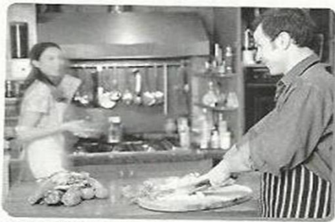
▲ MAN: Will you please go to the store for some eggs?

1 Discussing Gender Communication Styles Look at the following photos and read the captions. Then answer the questions that follow.