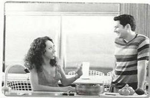
▲ WOMAN: I really need a few things from the store, but I'm so tired.