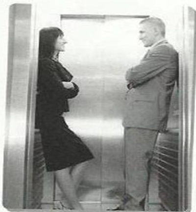
▲ MAN: It's a nice day.