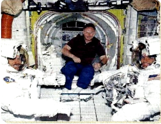
▲ Would you like to travel into space?

F Travelers who return from a vacation often answer the question "How was your trip?" by saying, "Oh, it was out of this world!" By this idiom, they mean, of course, that their trip was amazing or wonderful. However, people will soon be able to use this expression literally, but it will be expensive.