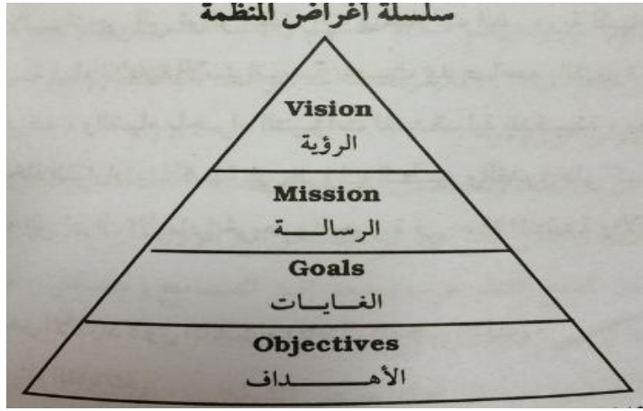
شكل رقم (3-5)