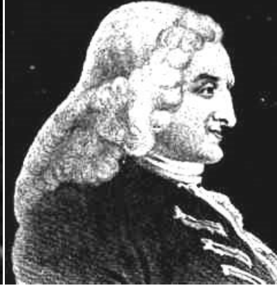
Henry Fielding 1707- 1754

Shamela (1741) Joseph Andrews (1742), and Tom Jones (1749)