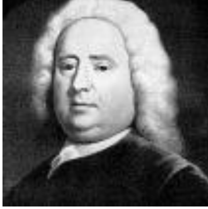
Samuel Richardson 1689 - 1761