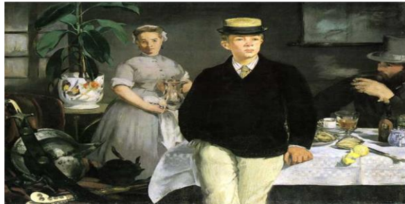
Compare: Édouard Manet, "Breakfast in the Studio" (Realist Art)