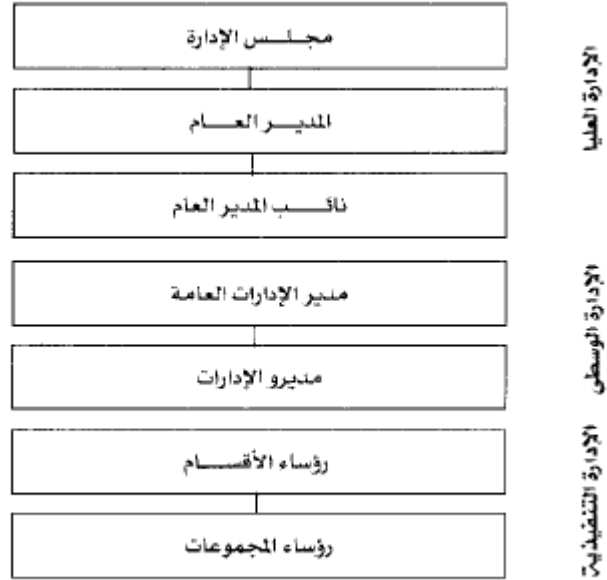
الشكل رقم (٦): تسلسل خطوط السلطة

مزايا الخارطة التنظيمية: تعطي صورة عن كيفية تقسيم العمل - تعطي صورة واضحة عن نطاق الاشراف للادارات والاقسام - تعطي فكرة واضحة عن حجم ومستويات الأعمال الإدارية - تساعد الافراد في معرفة ما يمكن عمله - تعطي صورة واضحة عن انواع السلطات الوظيفية والاستثمارية والتنفيذية في المنظمة