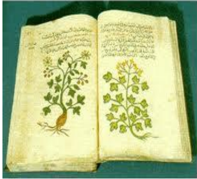
كتاب ابن البيطار