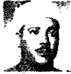
الشيخ عبد الباسط عبد الصمد