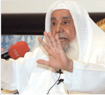
الشيخ سليمان الراجحي