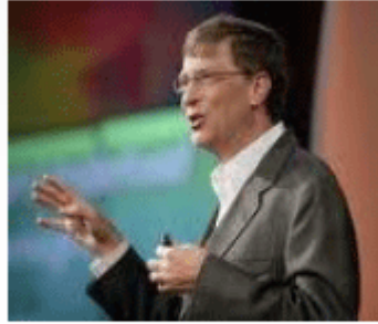
Bill Gates Microsoft