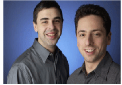
Sergey Brin - Larry Page Google