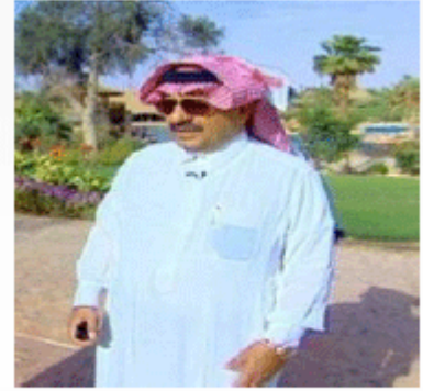
سلطان بن محمد بن سعود الكبير