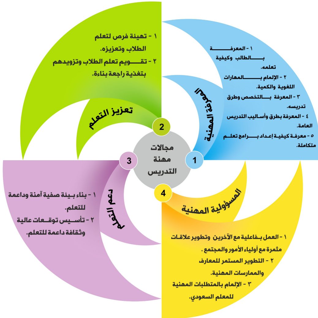
شكل (٢) مجالات مهنة التدريس ومعاييرها

تتكون المعايير كما يتضح من الشكل (٢) من أربعة مجالات رئيسة يعتمد كلٌ منها على الآخر، وهي: المعرفة المهنية (التخطيط للتعليم) والممارسة المهنية (تعزيز التعلم) والبيئة الصفية (دعم التعلم) والمسؤولية المهنية. وتحدد هذه المجالات ما ينبغي على المعلم معرفته وأداؤه، كما تبين نطاق عمله، ويندرج تحت كل مجال عددٌ من المعايير التي تحدد ما ينبغي على المعلم معرفته والقدرة على أدائه ضمن نطاقه، وتُفصّل المعايير بعد ذلك بعدد من المؤشرات التي تغطي محتوى كل معيار وتمثل نطاقه.