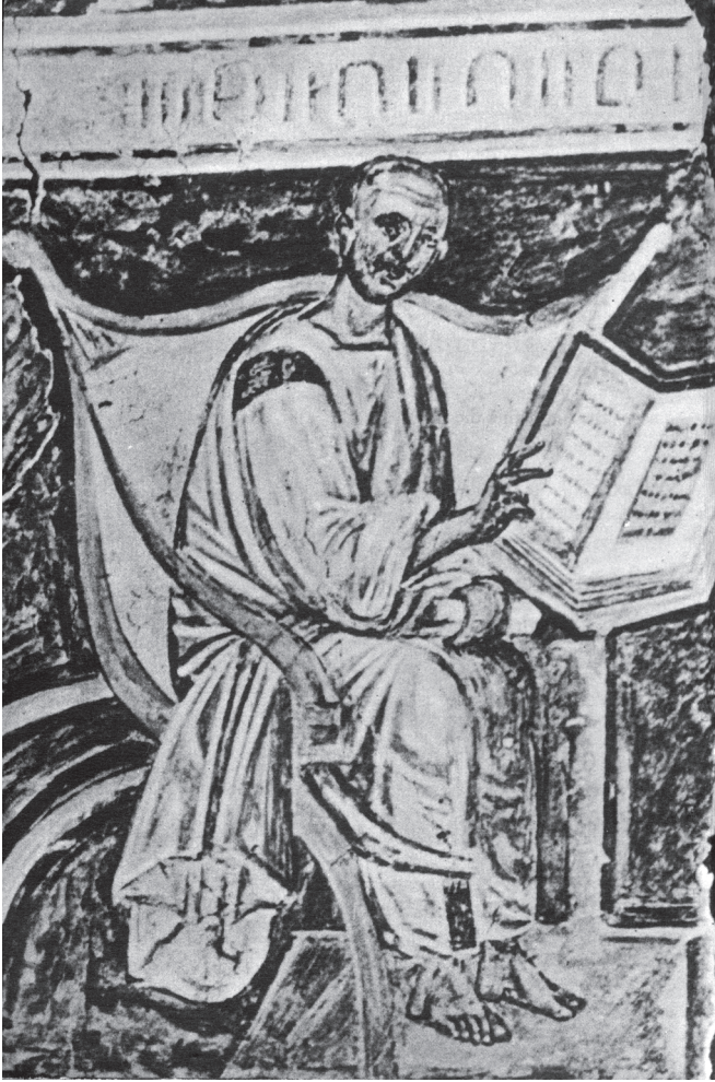
شكل ١-١: أقدم صورة للقديس أوغسطينوس. تصويرٌ جصّي، القرن السادس.

حصَّلَ هو تلك الثقافة من طريق التعليم. ومن خلال كتاباته التي يتجاوز ما تبقى منها ما وضعه أيُّ مؤلِّف قديم، أمسى يُمارس أثرًا واسعًا لا على معاصريه وحسب، بل وخلال