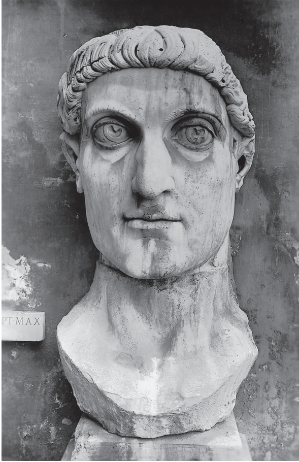
شكل ٩-٣: تمثال ضخّم لرأس الإمبراطور قسطنطين العظيم من كاندراثة ماكسينتيوس. قصر الأمراء، روما.

إلى مستوًى أعلى لغاية الرب. ومن المعروف أن عدد المواطنين الذين تمس العناية الإلهية حياتهم لا يتجاوز أقلية قليلة جدًا، لكن هذه الأقلية يمكن أن تكون ذات أهمية عظيمة. لقد فهم فهمًا وافيًا أن الحكومة أكثر فعالية في قمع الرذائل من التشجيع على الفضائل.