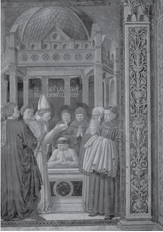
شكل ١-٣: مشاهد من حياة القديس أوغسطينوس: تعميد القديس أوغسطينوس، ١٦٤٥ بريشة بينوزو جوزولي. تصوير جصّي، كنيسة القديس أوغسطينوس، قرية جيمنيانو، إيطاليا.

فكرةً لأبي وجودٍ أسمى منه. ولذا، فإنه «هو» موضوع الهيبة والعبادة. ولا ينبغي أن نفكر في الرب على اعتبار أنه منخرط في صراع من الأدنى إلى الأعلى كالبشر (وكقوة النور المانوية)، بل على اعتبار أنه يمتلك غاية إبداعية وتخليصية متسقة فيما يتعلق بالكون