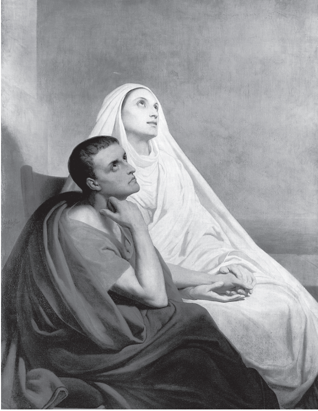
شكل ٦-٢: القديسان أوغسطينوس ومونيكا عام ١٨٥٤، بريشة آري شيفر.

الحواس بقدر ما تكمن في موافقة العقل، «لقد أصبحت مشكلتي الخاصة» (الاعترافات، الكتاب العاشر). ويختتم الكتاب العاشر بالاعتراف باستسلام النفس لنعمة الله المتسامح، المرهون بسر القربان المقدس، وهي فكرة غير أفلاطونية بالمرّة. لكن هذا يُفضي بنا إلى استقصاء دقيق لطبيعة الزمن.