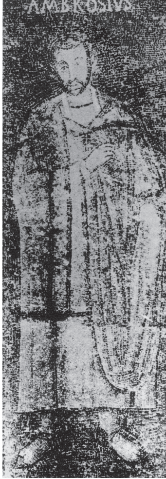
شكل ٨-١: لوحة فنية معاصرة للقديس أمبروسيو، ميلانو، القرن الرابع.

كان لجهود أوغسطينوس في بيان فكرة التثليث عميق الأثر على المفاهيم الغربية اللاحقة المتعلقة بالشخصية. ظنُّ فرفوروس أن كلَّ الأرواح تشترك في «روح عالمية»؛