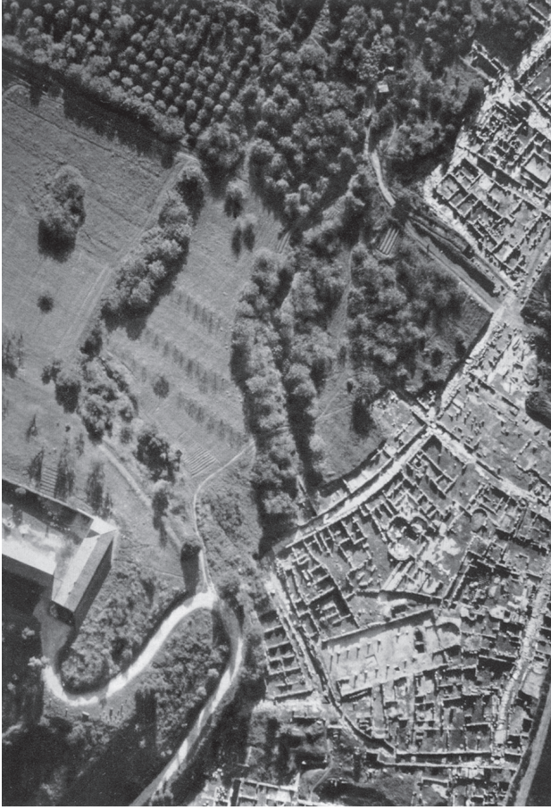
شكل ٥-١: صورة جوية لأطلال كنيسة القديس أوغسطينوس بمدينة هيبو.

عائقًا أمام ارتقاء الروح إلى الرب، وظن أن المؤمن يجب أن يكون حذرًا طوال الوقت من التراخي الغادر. وكثير من الفقرات في أعمال أوغسطينوس تحذر القراء من حقيقة أن الأثر المفسد والمدمر للعادة الأثيمة يبدأ بـ «أشياء بسيطة». وفي «الاعترافات» (الكتاب التاسع)، أشار كذلك إلى الطريقة التي اكتسبت بها أمه مونيكا في شبابه عادةً احتساء