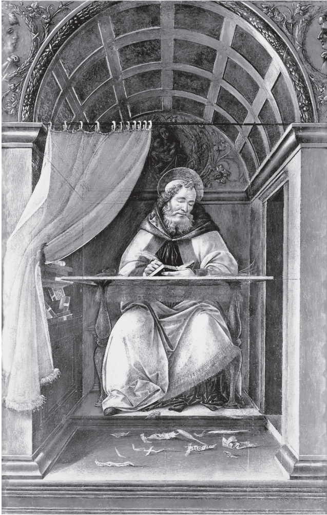
شكل ١٠-١: القديس أوغسطينوس في صومعته في القرن الخامس الميلادي، بريشة ساندر بوتشيلي. معرض أوفيزي، فلورنسا.