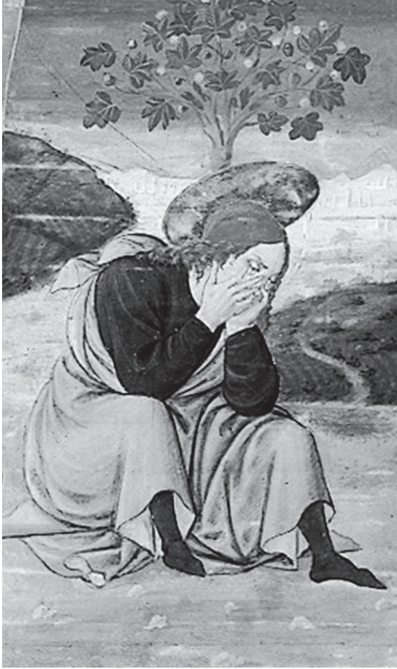
شكل ٦-١: القديس أوغسطينوس في «عالم التباين» من مخطوطة ترجع للقرن الخامس عشر بمكتبة لورينتيان، فلورنسا.

والصداقة سلوان يمنحه الرب في عالم قاسٍ (مدينة الله). كانت مونيكا بالنسبة إلى أوغسطينوس أسمى الأصدقاء؛ فقد أدرك أن حبها وطموحها وحبها للتمكُّ كل ذلك