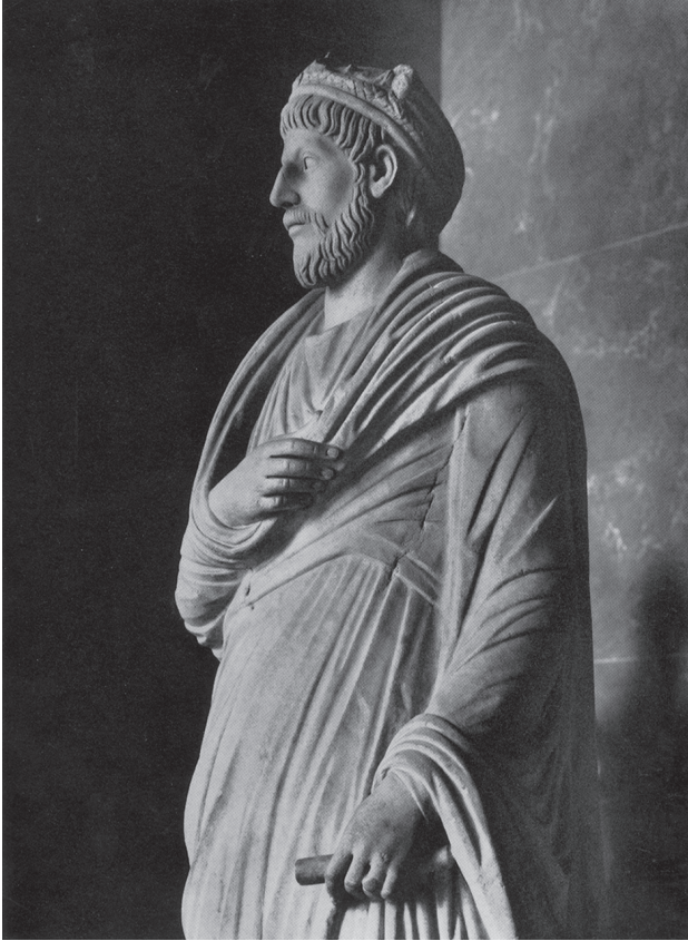
شكل ٩-١: الإمبراطور يوليان المرتد.

وفيما يتعلق بمسألة الطائفة (كما رأينا من قبل)، كتب فرفوروريوس وجّهتِي نظري؛ فمن ناحية، أقرّ بأن الطقوس القديمة كان لها ثقل التقليد السحيق، ولا شك أنها استرخت أرواحًا شريرة؛ ومن ناحية أخرى، مقت فرفوروريوس القرابين من الحيوانات.