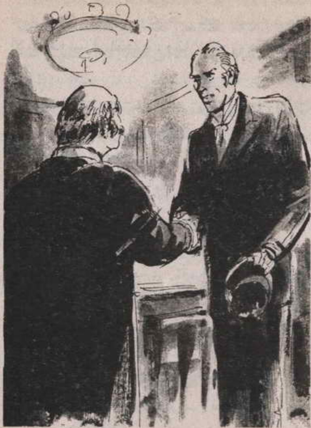
أرى كتلة من البدانة الشاحبة في عباءة ، وأعرف أن هذا هو الرجل العظيم نفسه

صمت الموت .. دخلت أحد هذه الشقوق ، وصعدت في درج ممسوح ، ودخلت أول باب قابلني .. كانت هناك امرأتان إحداهما بدينة والأخرى نحيلة ، تجلسان على مقاعد من قش وتحيطان الصوف الأسود . نهضت النحيلة ومشيت نحوى وهى مستمرة فى الحياكة وعيناها لأسفل ، حتى إننى حاولت التنحى عن طريقها كما تفعل أنت مع من يمشى فى أثناء النوم .