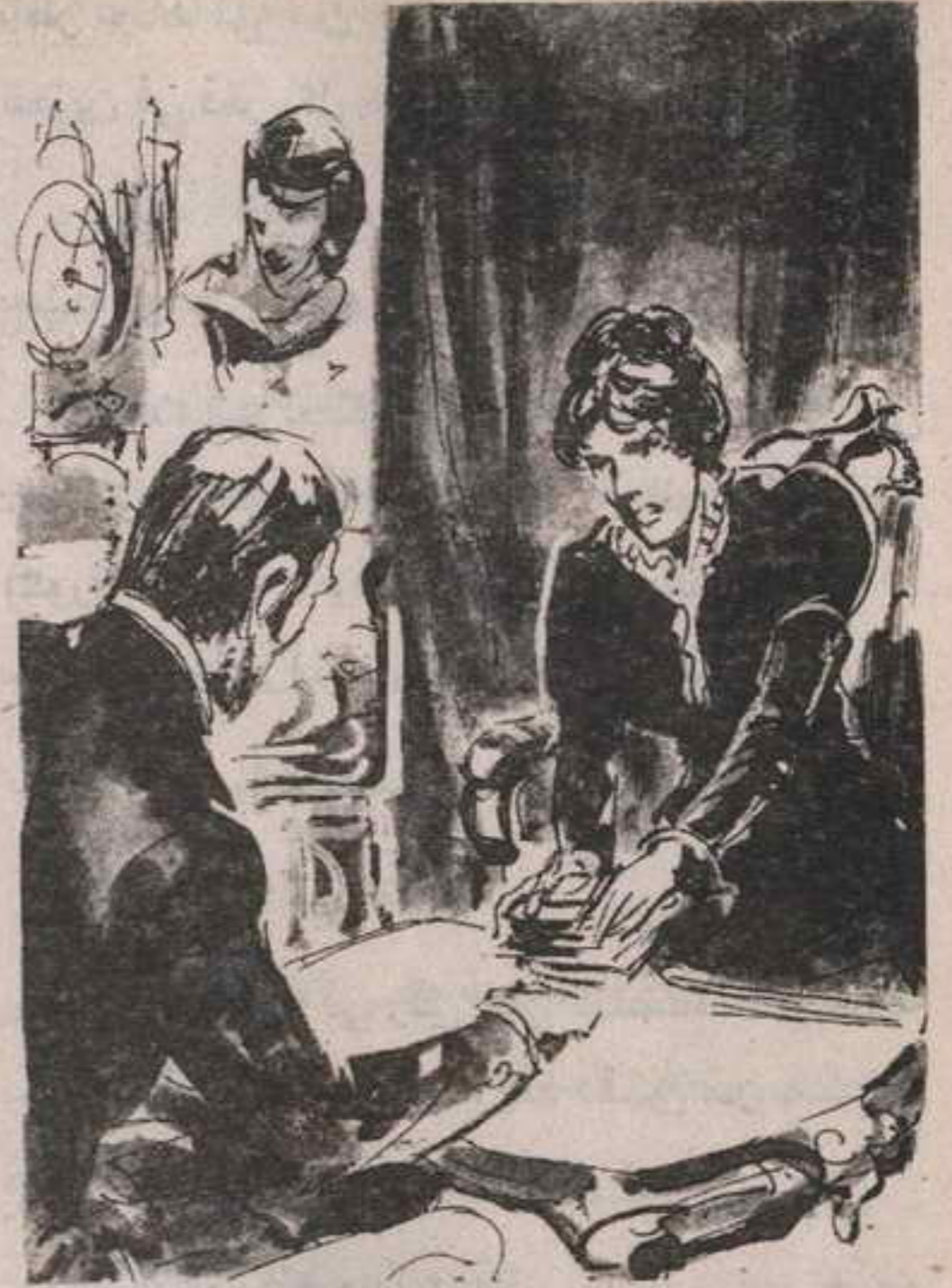
وضعت الحزمة في رفق على المنضدة ، فوضعت يدها عليها ..