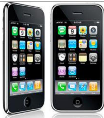
Mobiles / i-phones