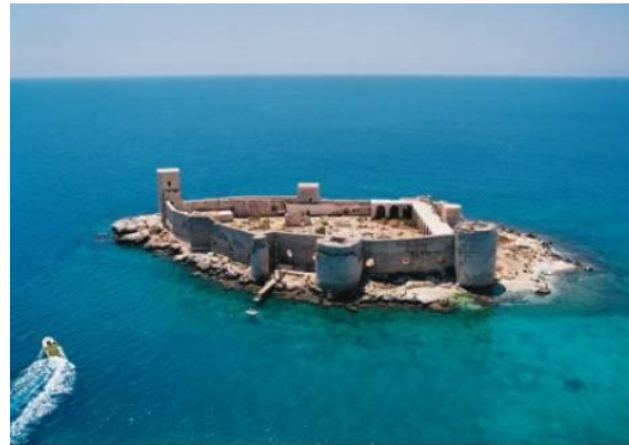
إحدى القلاع الأثرية في تركيا استانبول وسط البحر

المراكز العمرانية التي تشكل السياحة إحدى وظائفها : تمثلها المدن التاريخية كما في القاهرة ، استانبول ، أثينا ، دمشق ، ومدن الشواطئ والإصطياف ، كما في ميامي بفلوريدا ، ونيس في فرنسا ، ومدن الترفيه مثل والت ديزني في غرب أورلاندو بولاية فلوريدا ، مدن الحج والمزارات الدينية مثل مكة المكرمة والقدس وبيت لحم والناصرة .. وغيرها.