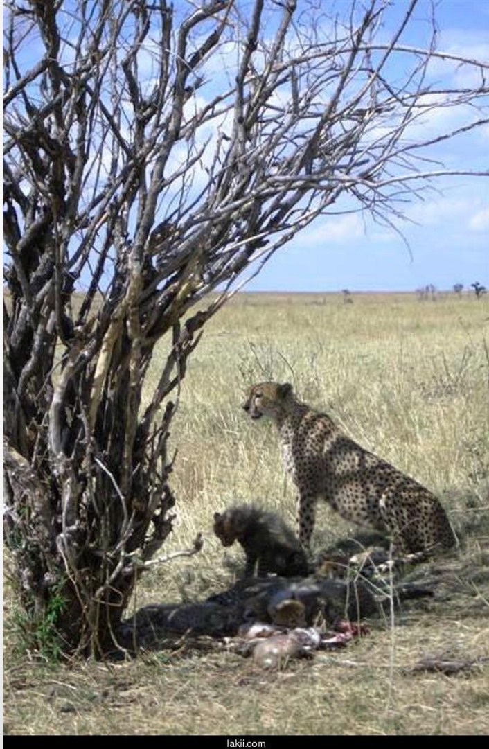
سفاري ممباسيا بكينيا