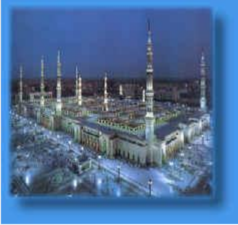
الحرم النبوي الشريف