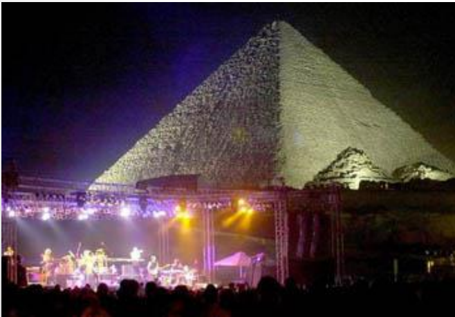
• الاهرامات بمصر