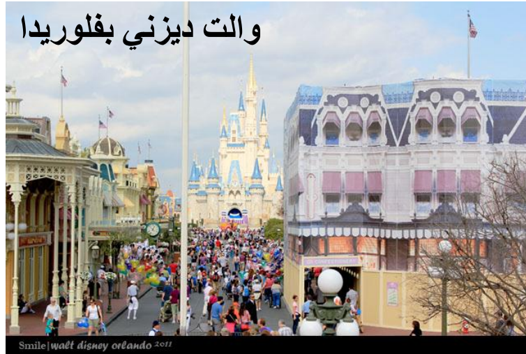
والت ديزني بفلوريدا