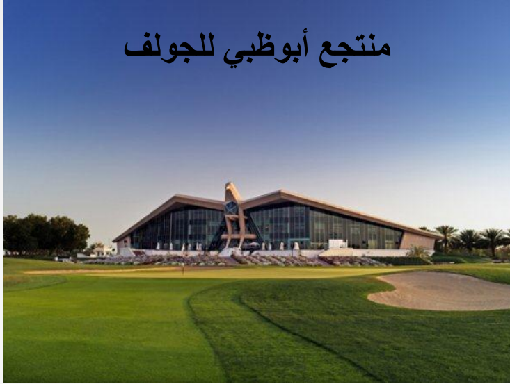
منتجع أبوظبي للجولف

المنتجعات الرياضية : وهي التي تشيد في مواقع متميزة من أجل ممارسة أنشطة رياضية وترويحية مختلفة كرياضة الجولف والتنس في بعض منتجعات الولايات المتحدة الأمريكية وحالياً أبو ظبي ، أو لممارسة الألعاب البحرية وصيد الأسماك كما في فلوريدا وهاواي وجزر البحر الكاريبي ، وتسلق الجبال كما في سويسرا وشمال إيطاليا.