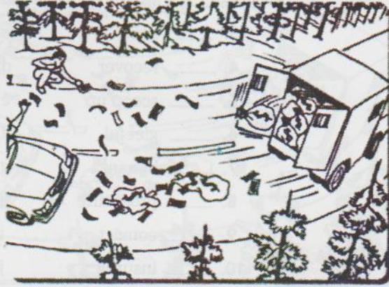
▲ An armored truck spilled bags of money on Interstate 71.

COLUMBUS, OHIO. October 28 was a fortunate day for motorists driving along Interstate 71 at about 9:30 in the morning. As a truck from the Metropolitan Armored Car Company sped down the highway, its back door blew open, and bags of money fell onto the road. When other vehicles hit the bags, the bags split open, spewing over a million dollars all over the highway.