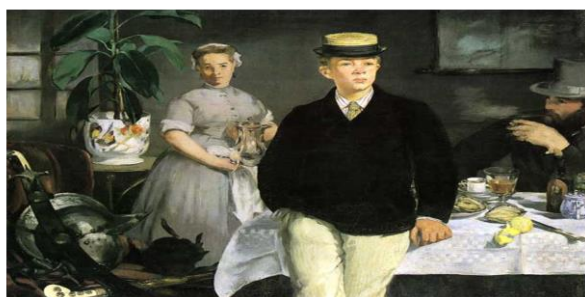
Compare: Édouard Manet, "Breakfast in the Studio" (Realist Art)