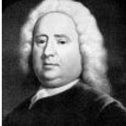
Samuel Richardson 1689 - 1761