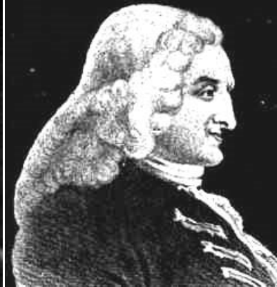
Henry Fielding 1707- 1754

Shamela (1741) Joseph Andrews (1742), and Tom Jones (1749)